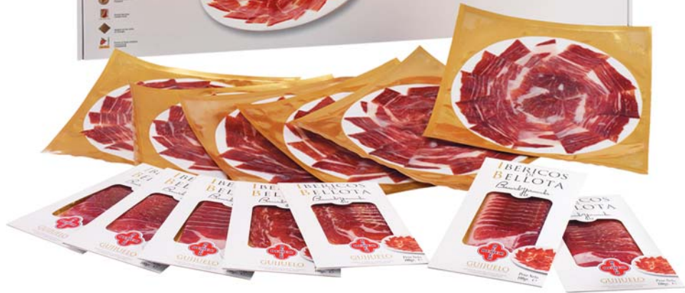
En la hoja adjunta encontrará todas las variedades de la gama de presentaciones siglo XXI de BEHER. No deje de tenerlas en cuenta.