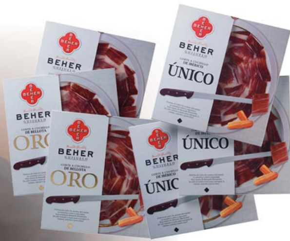
Estuches Jamón Ibérico Bellota Oro y Jamón Ibérico Único (corte a cuchillo plato de 90grs. netos)