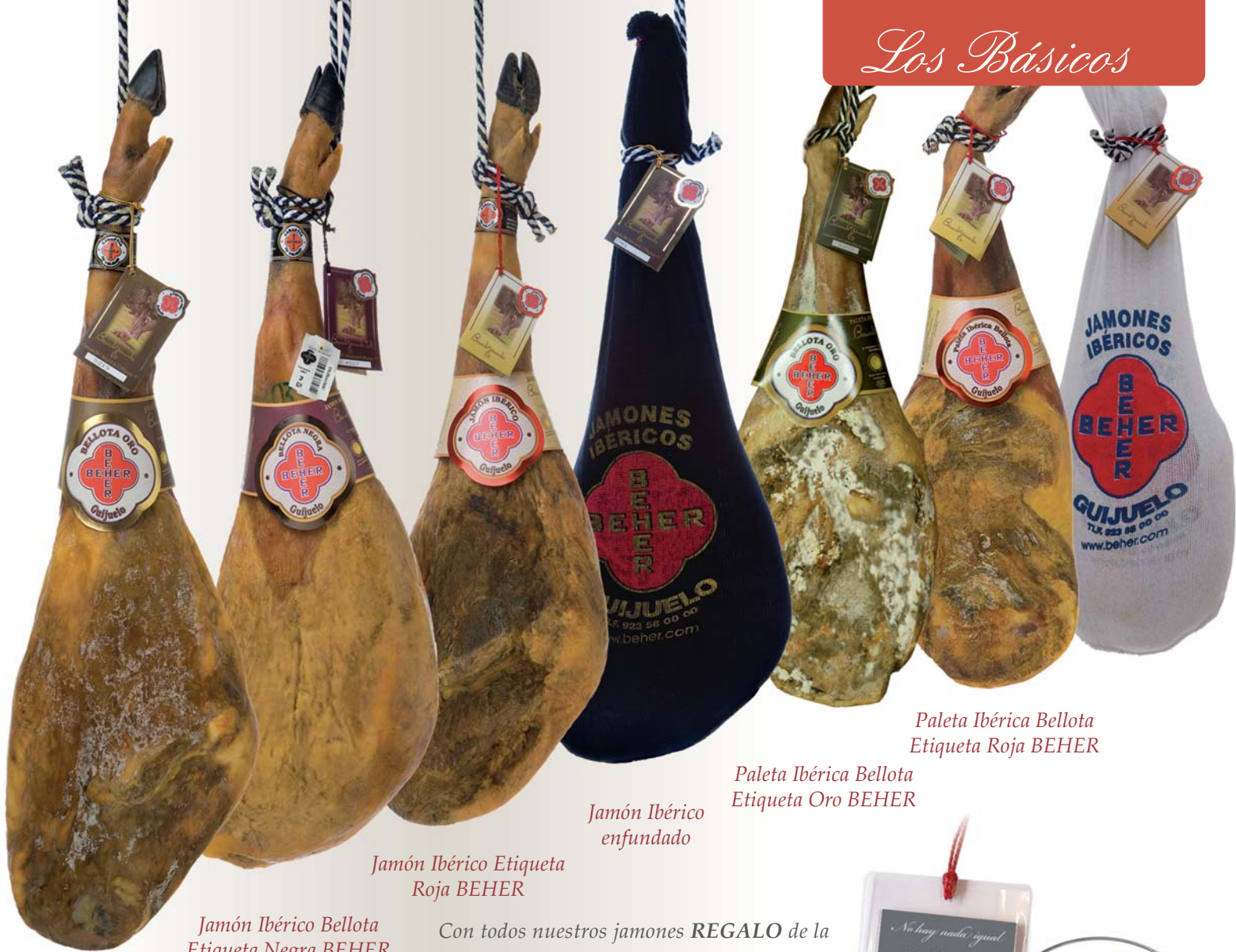
Jamón Ibérico Bellota Etiqueta Negra BEHER