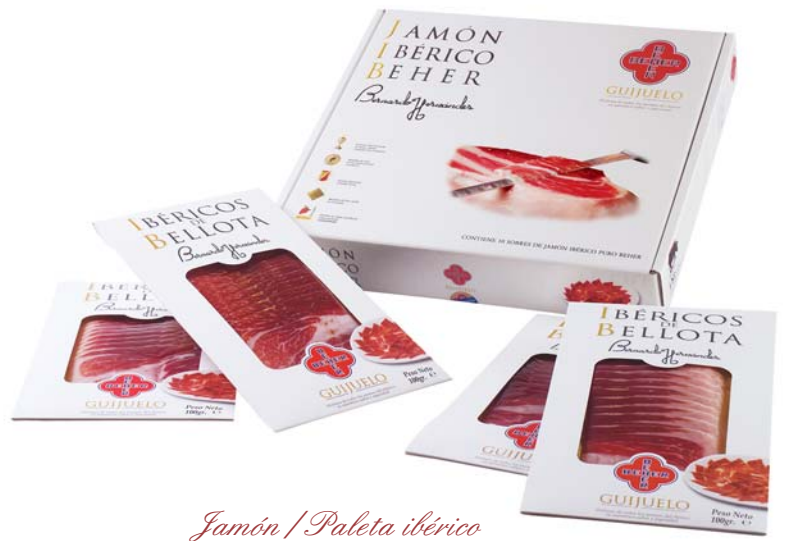
Jamón / Paleta ibérico Caja de 10 Estuches 1 Kg. neto